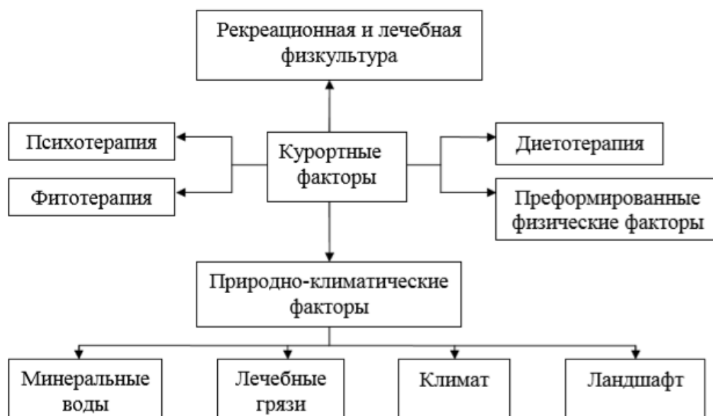
Рисунок 1 – Курортные факторы и их использование в лечебных и оздоровительных целях

Таблица или рисунок в тексте должны занимать не более одной страницы. Если аналитическая таблица или рисунок превышают одну страницу, их следует включать в Приложения.